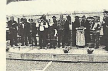
La troupe entonnant