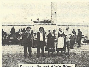
Encore 'in cot d'vin Bian'