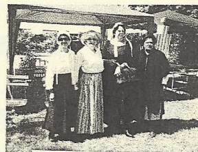
Ces dames du 'Fil du Briou'

Nous sommes allés soutenir la troupe patoisante "Au Fil du Briou" très applaudie par un public de connaisseurs. Celle-ci nous informe que leur groupe envisage de reprendre son magnifique spectacle "Bonsoir Saintonge" en hommage à Goulebenéze, déjà donné à Haimps en septembre 2009. Les dates fixées seront les 19 & 20 février 2011 à Matha. Avis aux absents de la première buffée. !