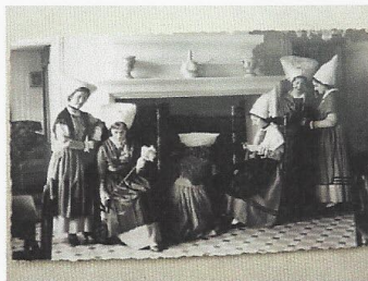
Une partie de la collection